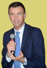
di Ettore Prandini