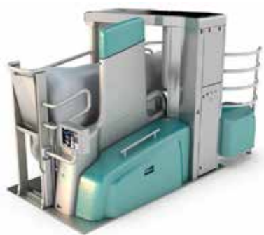
ROBOT DI MUNGITURA MONOBOX