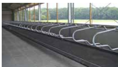
ATTREZZATURE PER STALLE