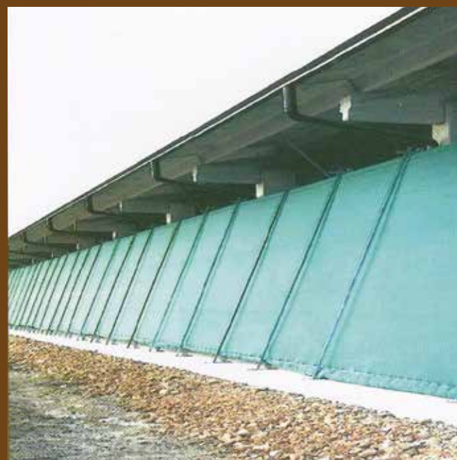
TELI PER STALLE

Produzione reti: OMBREGGIANTI-RACCOLTA OLIVE - ANTIGRANDINE SACCHI PER CORDOLI TRINCEE TUBOLARI PER IMBALLAGGI ORTOFRUTTA E PRODOTTI CASEARI SACCHI PER CONFEZIONAMENTO AUTOMATICO PATATE