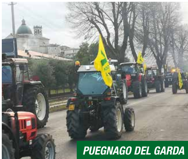
PUEGNAGO DEL GARDA

La Giornata del Ringraziamento è la tradizionale ricorrenza celebrata da Coldiretti in tutta Italia dal 1951, e simbolicamente legata al dipinto "L'Angelus" di J. F. Millet, per rendere grazie per il raccolto dei campi e per chiedere la benedizione sulla nuova annata. Una nuova annata che – nelle usanze contadine – ha inizio l'11 novembre, giorno di San Martino.