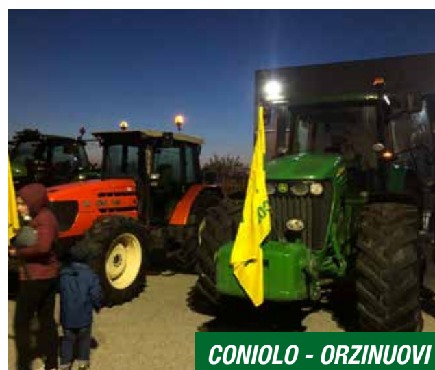
CONIOLO - ORZINUOVI