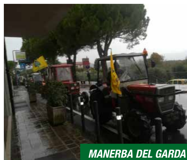
MANERBA DEL GARDA