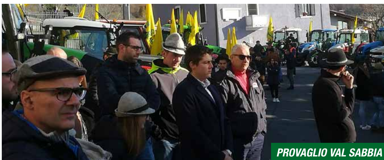
PROVAGLIO VAL SABBIA