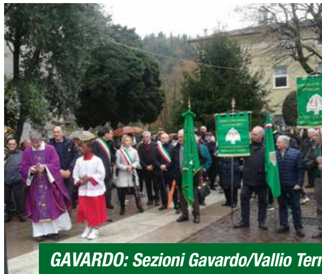
GAVARDO: Sezioni Gavardo/Vallio Terme, Villanuova sul Clisi e Calvagese della Riviera