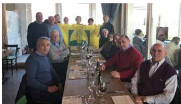
Una rappresentanza del gruppo dell'Associazione Pensionati di Coldiretti Brescia durante la visita al "Colmetto" di Rodengo Saiano