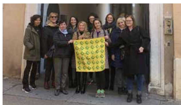
Il gruppo di Donne Impresa durante una visita al museo Santa Giulia di Brescia alla scoperta delle tradizioni enogastronomiche romane