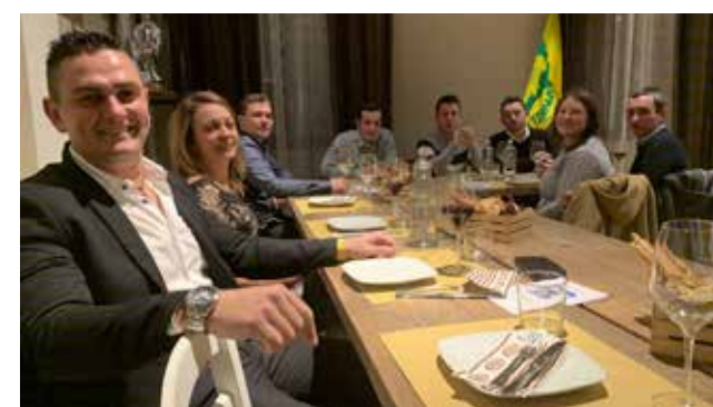
La cena per gli auguri di Natale del gruppo Giovani Impresa di Coldiretti Brescia al "Berlinghetto" di Berlingo