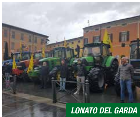
LONATO DEL GARDA