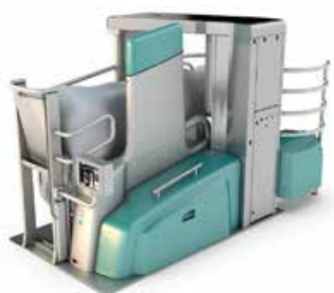
ROBOT DI MUNGITURA MONOBOX