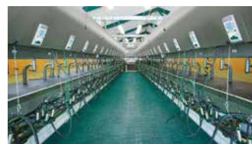
SALE DI MUNGITURA CONVENZIONALI