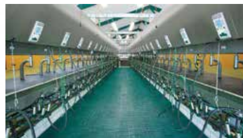
SALE DI MUNGITURA CONVENZIONALI