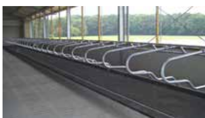
ATTREZZATURE PER STALLE