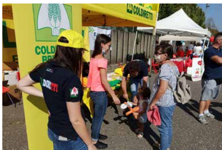
Dall'alto: rappresentanti presenti a Urago D'Oglio; un momento dell'evento; Urago d'oglio, il futuro siamo noi; un partecipante alla giornata di divertimento.

elicottero dove, professionisti di ogni livello, hanno mostrato numerose acrobazie ed evoluzioni dando la possibilità ai giovani spettatori, di diventare per un giorno protagonisti di un'esperienza indimenticabile. "Abbiamo aderito con piacere a questa iniziativa – conclude Demetrio Cerea segretario di zona Coldiretti ufficio Oglio Franciacorta – Coldiretti anche in questa occasione, è attenta alle attività sociali del territorio mettendo al centro le necessità e le esigenze di ragazzi e famiglie, a partire dalle persone più bisognose".