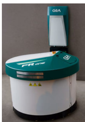
SPINGI FORAGGIO ROBOTIZZATO