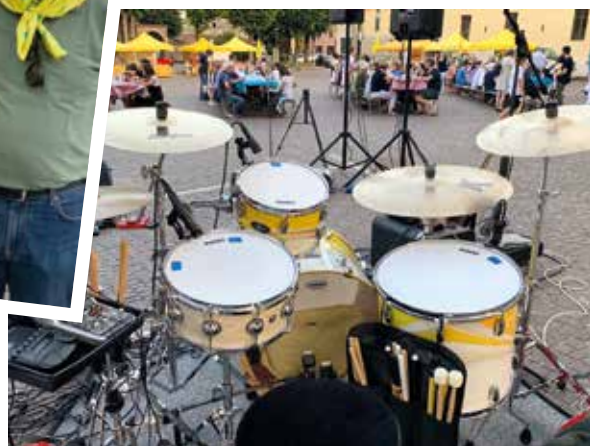
Campagna Amica accolta dal sindaco e dai cittadini di Isola Dovarese, nella prima partecipazione alla Festa del Luartis