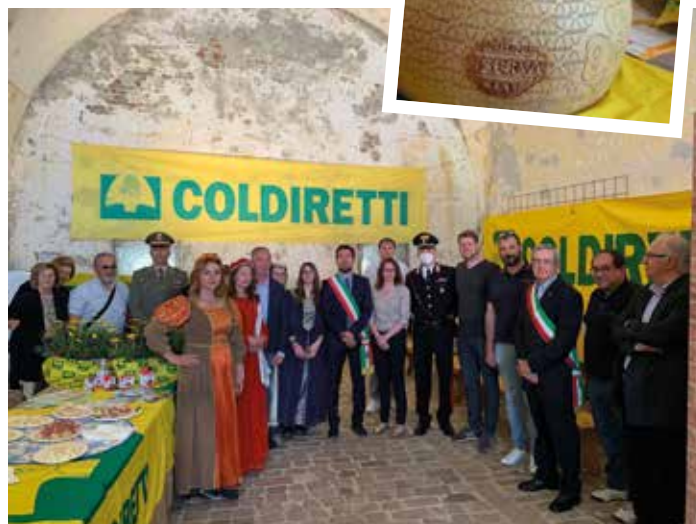
Momenti di festa e di incontro condivisi con gli amministratori del territorio allo stand di Coldiretti, nelle antiche mura di Pizzighettone