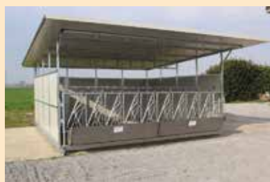
Box accrescimento vitelli con cancello anteriore completo di autocatture antisoffoco, mangiatoia e abbeveratoio (dim. 330x330 - 430x430)

Abbeveratoio a vasca con protezione antischizzo per cuccette e tappo a svuotamento rapido