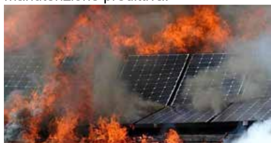
Figura 1: Impianto fotovoltaico

Gli impianti fotovoltaici, non oggetto di regolare ispezione e manutenzione, sono facilmente soggetti al surriscaldamento a causa di difetti che possono essere riscontrati sui moduli e sui componenti principali, quali inverter e quadri elettrici, comportando un grave rischio di incendio. Esistono tuttavia alcuni interventi che permettono di ridurre il rischio di incendio. Tra questi la più efficace è la verifica termografica, rientrante tra le attività definite di manutenzione predittiva.